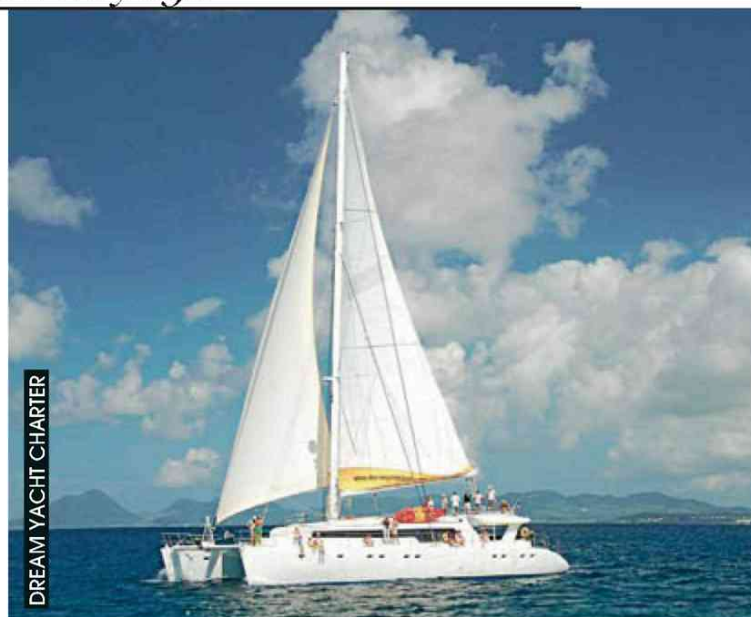
DREAM YACHT CHARTER

✓ Rens. : 01 55 35 00 30 et www.tselana.com